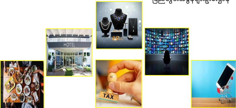
ပြည်တွင်းအခွန်များဦးစီးဌာန

အသေးစိတ်သိရှိလိုပါက အခွန်ထမ်းဝန်ဆောင်မှုဗဟိုအဖွဲ့ရုံး(ရန်ကုန်)၊ အမှတ် ၁၂၈/၁၃၂ (ဒုတိယထပ်နှင့်တတိယထပ်)၊ ပန်းဆိုးတန်းလမ်း၊ ကျောက်တံတားမြို့နယ်၊ ရန်ကုန်မြို့၊ ဖုန်း-၀၁-၈-၃၈၉၃၁၁၊ ဖုန်း-၀၁-၈-၃၈၉၃၂၂ သို့မဟုတ် အခွန်ဆိုင်ရာဝန်ဆောင်မှုရုံး (မန္တလေး)၊ ၆၅ လမ်း၊ ၂၂ x ၂၃ လမ်းကြား ၊ ဖုန်း-၀၂-၄၀၃၀၁၉၂ ၊ ဖုန်း-၀၂-၄၀၃၀၆၃၈၊ ဖုန်း-၀၂-၄၀၃၀၆၃၉ သို့မဟုတ် အခွန်ဆိုင်ရာဝန်ဆောင်မှုရုံး(နေပြည်တော်)၊ ဖုန်း-၀၆၇-၃၄၃၀၅၂၂၊ ၀၆၇-၃၄၃၀၅၄၄ သို့မဟုတ် သက်ဆိုင်ရာမြို့နယ်အခွန်ဦးစီးဌာနမှူးရုံး များသို့ စုံစမ်းမေးမြန်းနိုင်ပါသည်။ ပြည်တွင်းအခွန်များဦးစီးဌာန၏ Website ဖြစ်သော www.ird.gov.mm သို့ ဝင်ရောက်ကြည့်ရှုလေ့လာနိုင်ပြီး လိုအပ်သည့်ဥပဒေ၊ နည်းဥပဒေ၊ အမိန့်ကြော်ငြာစာ၊ လက်ကမ်းစာစောင်နှင့် ပုံစံများကိုလည်း download ရယူနိုင်ပါသည်။