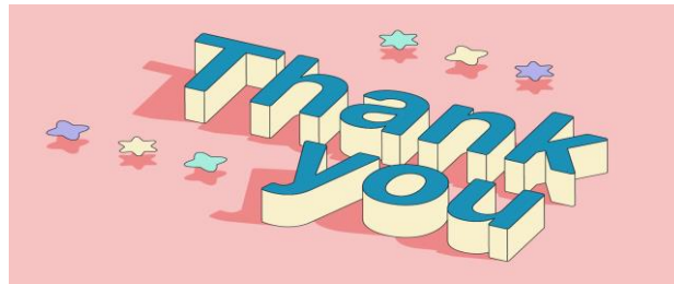
ပြည်တွင်းအခွန်များဦးစီးဌာန

အသေးစိတ်သိရှိလိုပါက အခွန်ထမ်းဝန်ဆောင်မှုဗဟိုအဖွဲ့ရုံး (ရန်ကုန်)၊ အမှတ် ၁၂၈/ ၁၃၂၊ (ဒုတိယထပ်နှင့်တတိယထပ်)၊ ပန်းဆိုးတန်းလမ်း၊ ကျောက်တံတားမြို့နယ်၊ ရန်ကုန်မြို့၊ ဖုန်း- ၀၁-၈၂၈၉၃၁၁၊ ဖုန်း- ၀၁- ၈၂၈၉၃၂၂၊ သို့မဟုတ် အခွန်ဆိုင်ရာဝန်ဆောင်မှုရုံး (မန္တလေး)၊ ၆၅ လမ်း၊ ၂၂ x ၂၃ လမ်းကြား၊ မန္တလေးမြို့၊ ဖုန်း- ၀၂- ၄၀၃၀၁၉၂၊ ၀၂- ၄၀၃၀၆၃၈၊ ၀၂-၄၀၃၀၆၃၉ သို့မဟုတ် အခွန်ဆိုင်ရာဝန်ဆောင်မှုရုံး (နေပြည်တော်)၊ ဖုန်း-၀၆၇-၃၄၃၀၅၂၂၊ ၀၆၇-၃၄၃၀၅၄၄ သို့မဟုတ် သက်ဆိုင်ရာ မြို့နယ်အခွန်ဦးစီးဌာနမှူးရုံးများသို့ စုံစမ်းမေးမြန်းနိုင်ပါ သည်။ ပြည်တွင်းအခွန်များဦးစီးဌာန၏ website ဖြစ်သော www.ird.gov.mm သို့ ဝင်ရောက် ကြည့်ရှုလေ့လာနိုင်ပြီး လိုအပ်သည့် ဥပဒေ၊ နည်းဥပဒေ၊ အမိန့်ကြော်ငြာစာ၊ လက်ကမ်းစာစောင်နှင့် ပုံစံ များကိုလည်း download ရယူနိုင်ပါသည်။